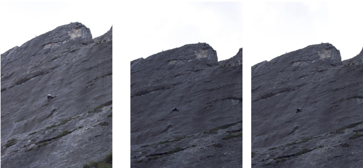
Robert Roithinger in der Schlüßelseilänge von Diallo, Diallo.

Abseilen über die Route, weiter wie im Topo und auf dem Wandfoto eingezeichnet wie bei der Vollendung, Ursprung des Lichts, etc.. Abstieg wie bei der Unvollendeten zu den obersten Leitern des Wasserfallweges möglich. Details s. Topo, Foto und Topo Ursprung des Lichts.