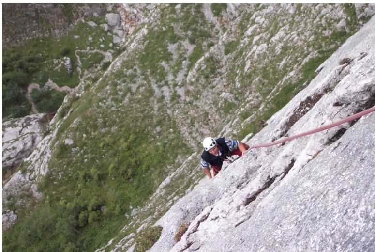
durch lichten Wald weiter. Bei Nässe besteht hier aber große Absturzgefahr!